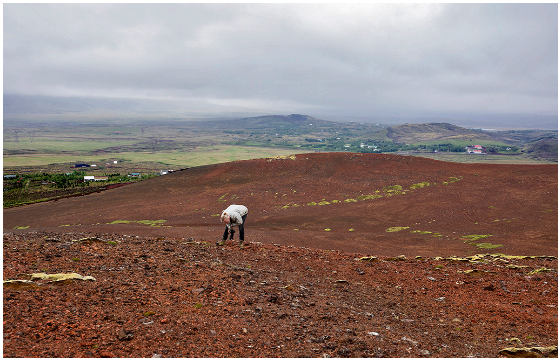
2. mynd. Gróðurathuganir í Seyðishólum 1. júlí 2021. Hraungambri vex á blettum í rauðamölinni.