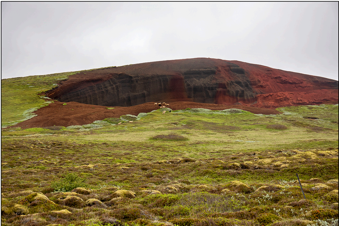
5. mynd. Náma Jarðefnaiðnaðar 1. júlí 2021. Ríkjandi vistgerð er lynghraunavist. Loðvíðir er áberandi kringum námuna. Ljósm. JÓH.

Samkvæmt vistgerðarkorti Náttúrufræðistofnunnar (6. mynd) finnast þrjár vistgerðir á athugunarsvæðinu: Lynghraunavist (L6.4, 5. mynd) með miðlungi hátt verndargildi, eyðihraunavist (L6.1) með lágt verndargildi og mosahraunavist (L6.3) með miðlungi hátt verndargildi. Þetta eru allt vistgerðir í vistlendum hraunlendi. Samkvæmt gróðurkorti í skýrslu Sveins Jakobssonar o.fl. eru gróðurlendi helst mosapemba, kvistlendi, gras-sefmóar og rauðamöl. Í jaðrinum mátti finna mýri og ræktuð svæði. Það kemur heim og saman við vistgerðarkortin og athuganir okkar.