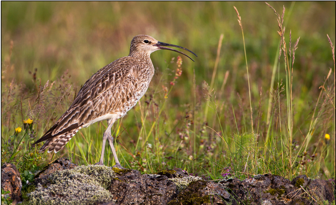
3. mynd. Spói var algengasti fuglinn á athugunarsvæðinu.

Í báðum heimsóknnum gengum við skipulega vítt og breitt um hólana. Skráðum fugla og plöntur sem fyrir augu bar (2. mynd). Athugunarsvæðið er afmarkað á 1. mynd en við skoðuðum einnig námurnar norðaustan við Seyðishóla. Svæðið bauð ekki uppá sniðtalningar á fuglum, meðal annars vegna þess að nokkuð var liðið á varptímarn í fyrri heimsókninni. Aðeins háplöntur voru skráðar, þó algengasti mosi og flétta séu nefnd. Engar þekjumælingar voru gerðar.