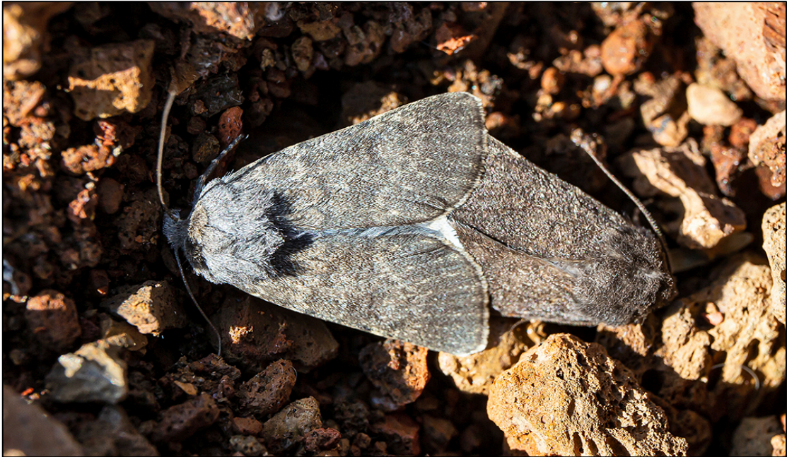
4. mynd. Bergyglur á góðri stundu í Seyðishólum 9. ágúst 2021.

nánar. Þetta er allnokkur fjöldi, miðað við stærð svæðisins og gróðurþekju á stórum hluta þess, en talsverður hluti hólanna er lítt eða ógróinn (1. og 2. mynd). Ríkjandi mosar voru af ættkvíslinni Racomitrium , væntanlega aðallega hraungambri ( Racomitrium lanuginosum ). Fléttan hreindýrakraókar fannst víða, en annars voru fléttur ekki skráðar.