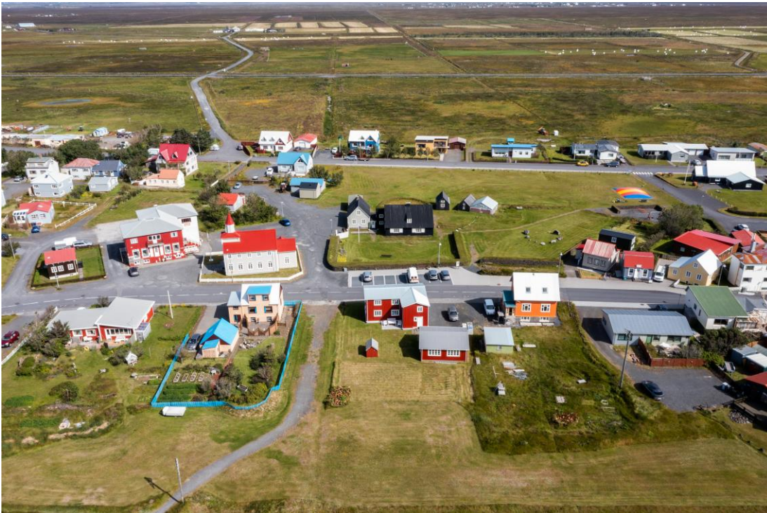
Safnasvæðið sumarið 2022.

Í stofnskrá safnsins segir um hlutverk þess: „Hlutverk Byggðasafns Árneseinga er að safna, skrá, varðveita, forverja og rannsaka minjar um byggða-, menningar- og atvinnusögu Árneseýsly og kynna þær almenningi.“ Safnað er eftir söfnunarstefnu. Skráð er í gagnagrunninn Sarp sem sýnilegur er á www.sarpur.is . Við safnið fer jafnframt fram forvarsla, rannsóknir, ráðgjöf, upplýsingagjöf, umsýsla í geymslum, undirbúningur og gerð sýninga, frágangur sýninga og útlán. Á undanförunum árum hefur verið áttak í gangi um myndvæðingu færslna í Sarpi.