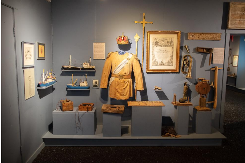
Sjóminjasafnið á Eyrarbakka.

Sjóminjasafnið á Eyrarbakka tekur þátt í starfi Sambands íslenskra sjóminjasafna en markmið SÍS er að vera sameiginlegur vettvangur sjóminjasafna um sín mál, einkum á sviði söfnunarstefnu, kynningarmála og erlendra samskipta. Á vegum SÍS er unnið að gerð ítarlegrar bátaskrár sem er nær tilbúin og eru sex bátar frá Sjóminjasafninu listaðir upp. Safnstjóri sat aðalfund SÍS á Hallormsstað í október.