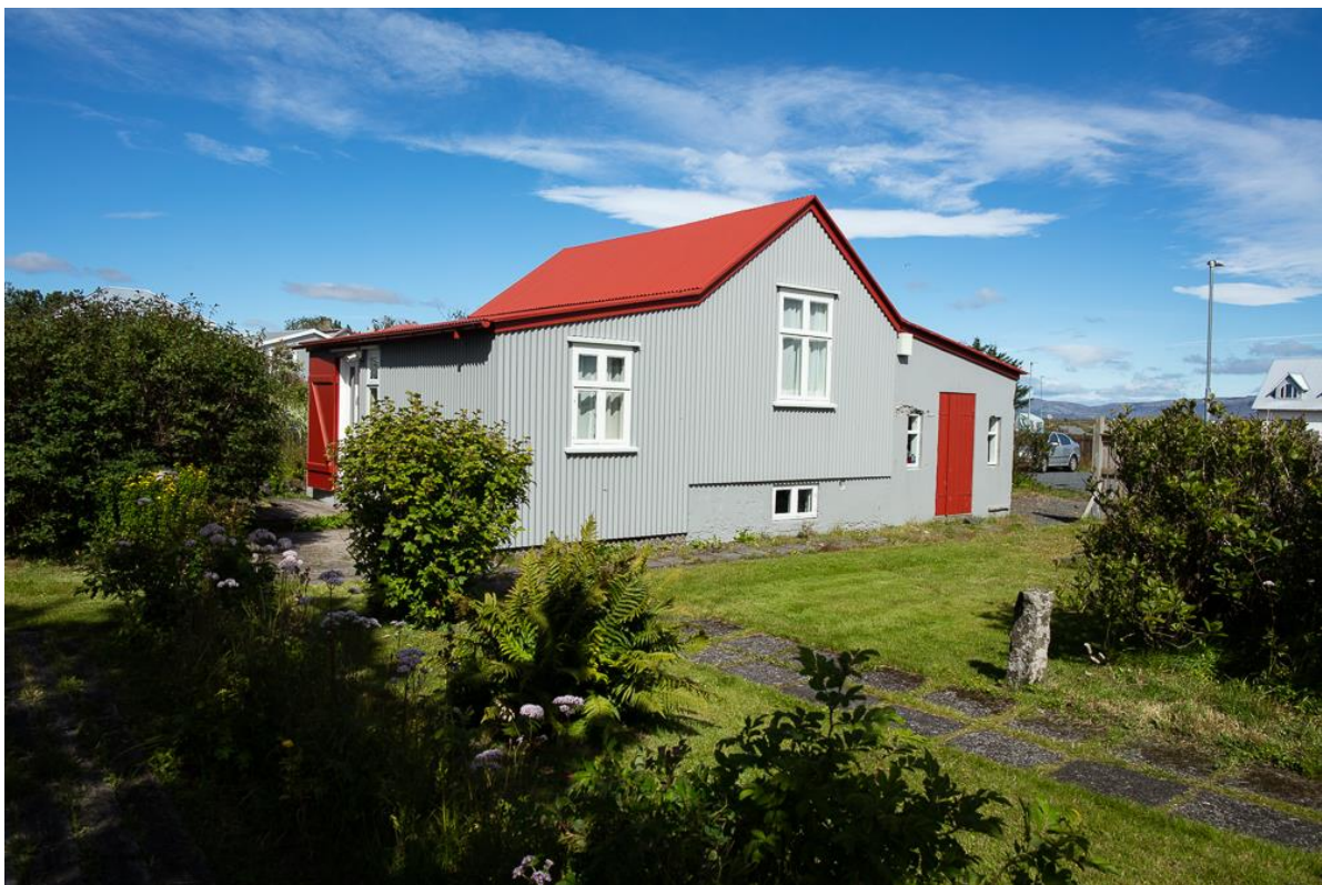
Kirkjubær sumarið 2022.